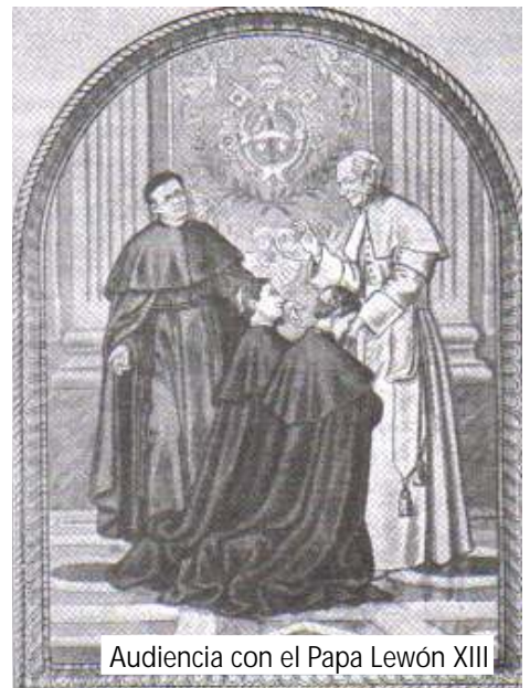
Audiencia con el Papa León XIII

algunos, ciertamente, católicos. Así pues, los aproximadamente 500 católicos, dispersos sobre un territorio tan grande, no veían en años un misionero, en muchas partes no disponían de capilla y mucho menos de una escuela católica.