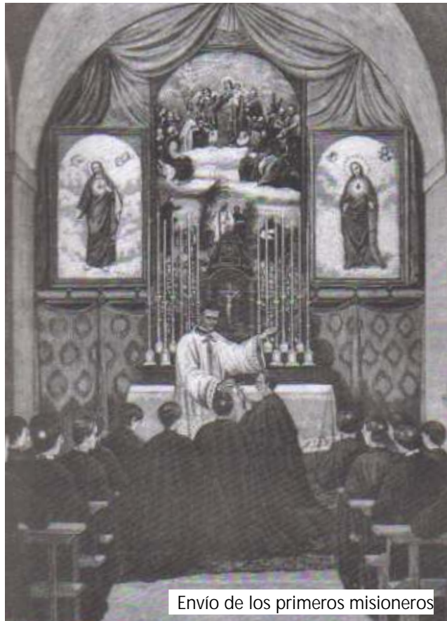
Envío de los primeros misioneros

La entrega de esta misión de Assam al joven Instituto del padre Jordán, reforzó visiblemente en este