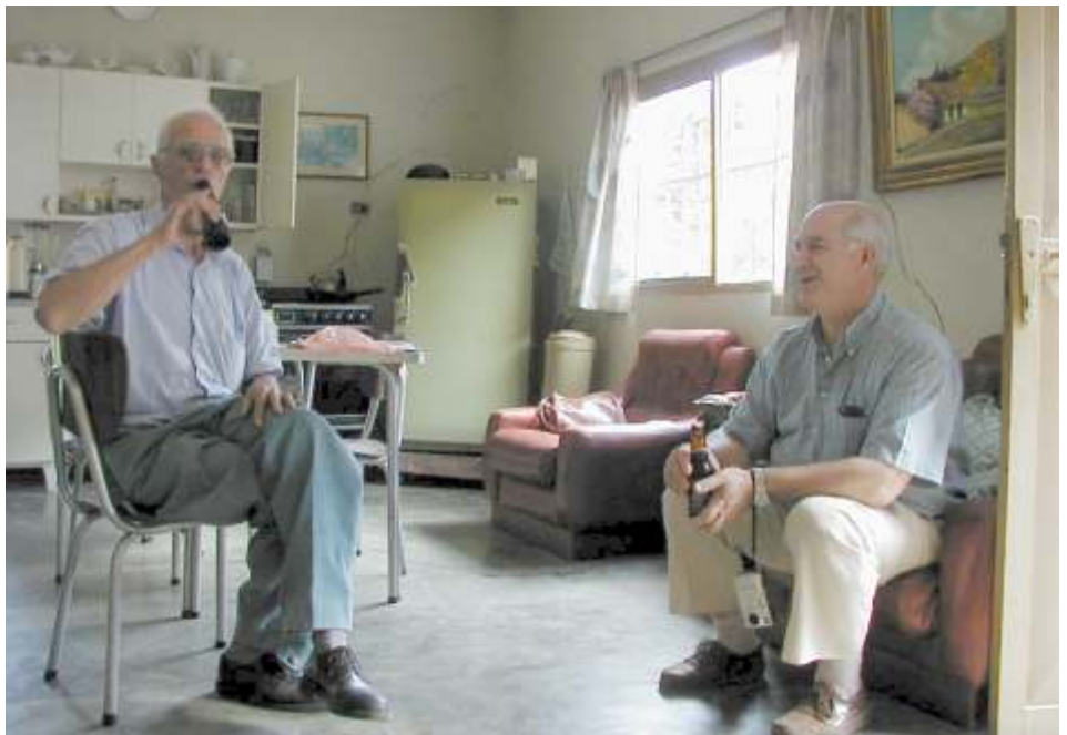
"Soy ateo gracias a Dios" - Luis Buñuel

Durante tres cuartos de horas no dejaron de pegarme y amenazarme con matarme si no les decía dónde estaban. Yo ya me había encomendado a Dios, pues daba por hecho que me iban a matar, pues no tenía nada de valor, y menos joyas.